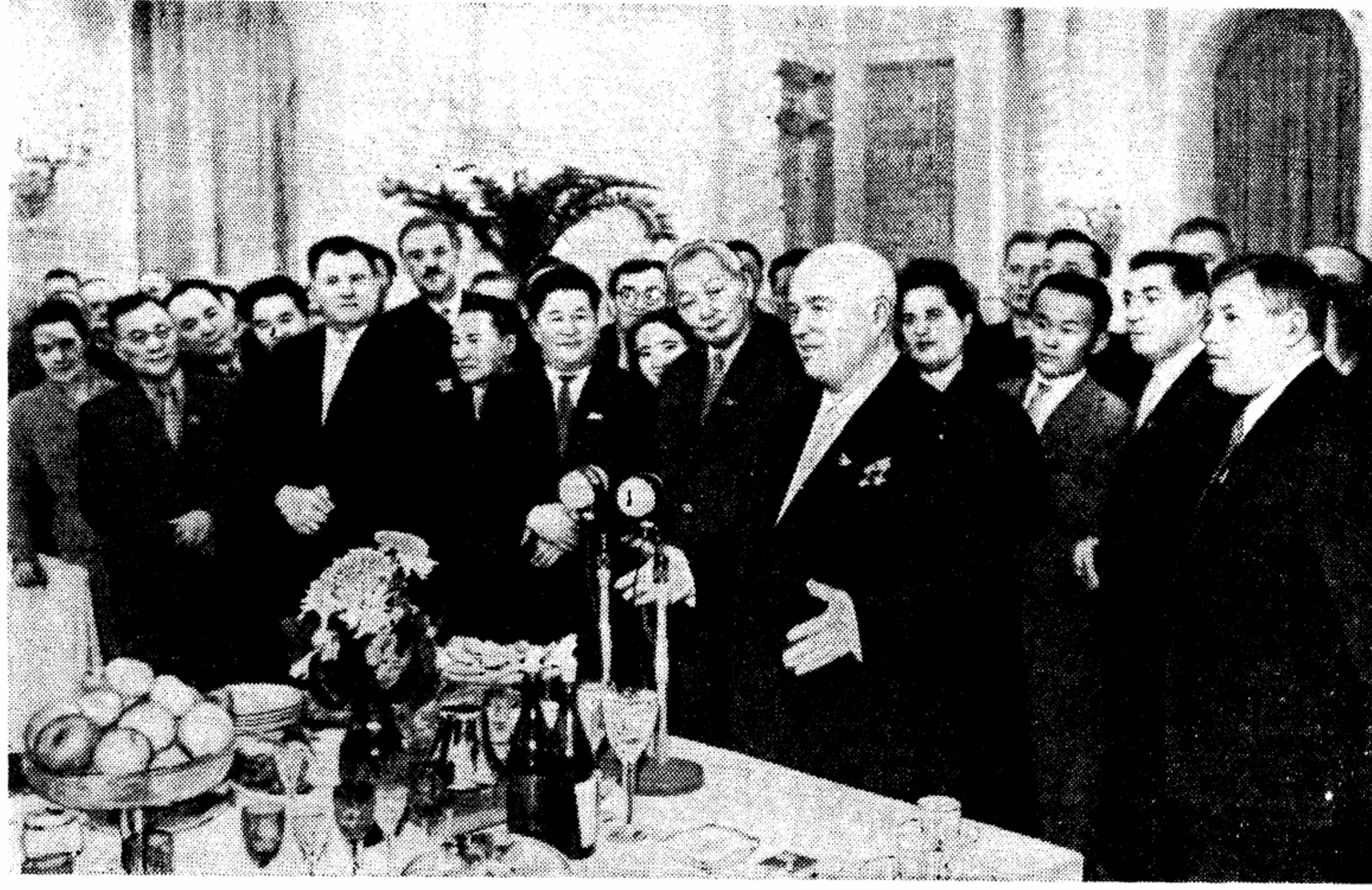
В Большом Кремлевском дворце. Выступает товарищ Н. С. Хрущев.