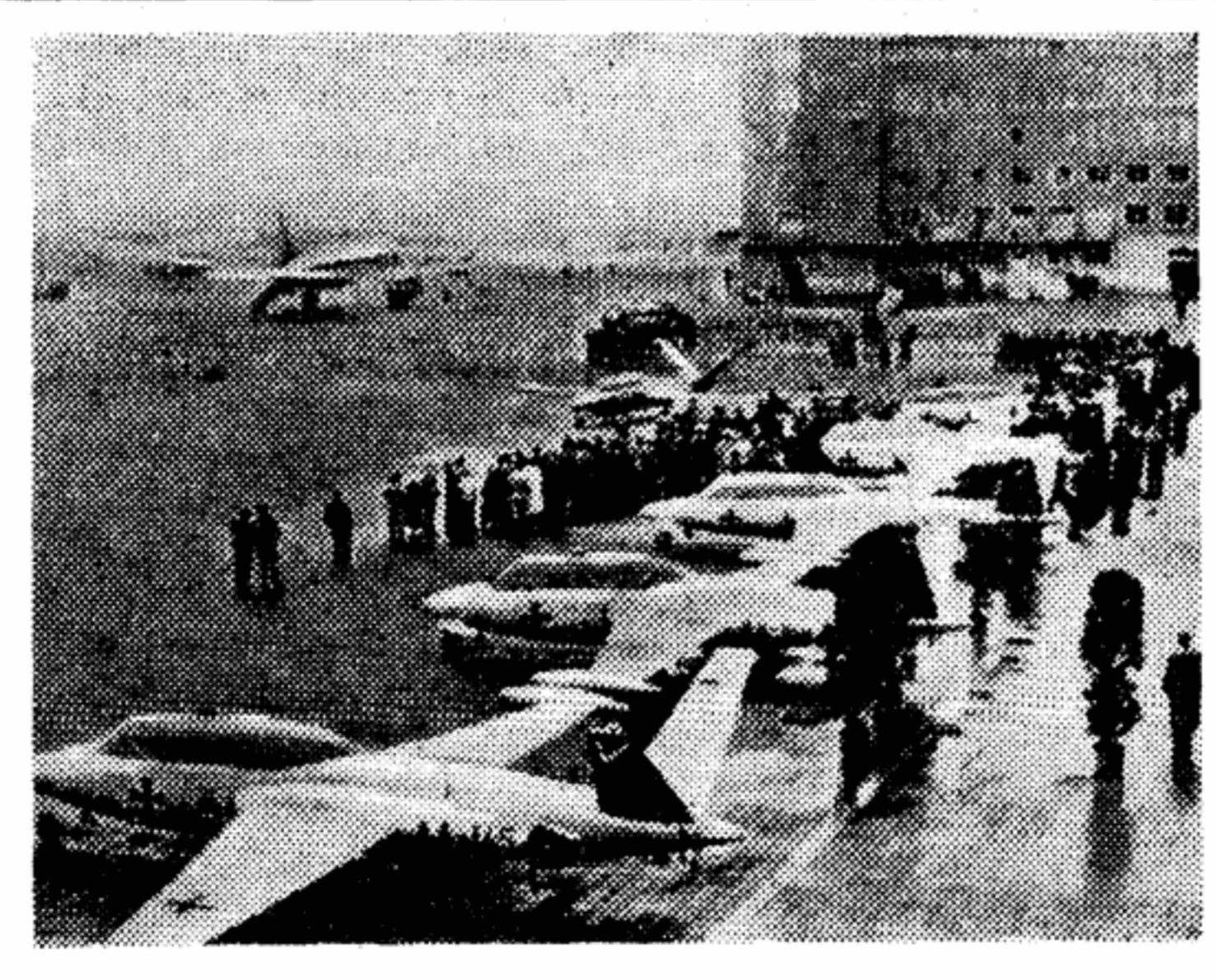
Вот одно из многих конкретных свидетельств возрождения германского милитаризма. На мюнхенском аэродроме выстроились в ряд новенькие, с новейшей реактивными двигателями. Это все тот же «мессершмитт»! Старые поставщики и старые цели у заказчиков...